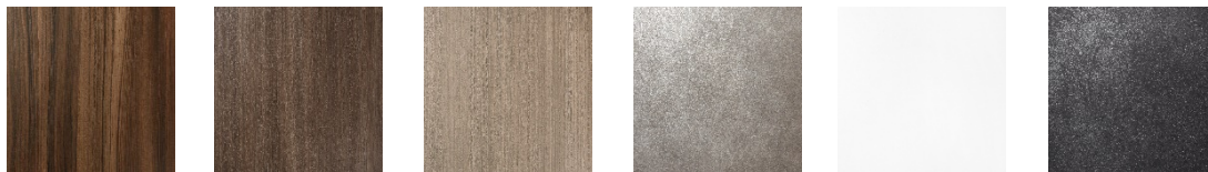
アレグロウッド カフェウッド グレージュウッド セメントシルバー ホワイト メタルブラック