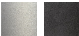
シルバー ブラック