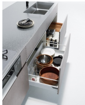
《ウィット》商品イメージ