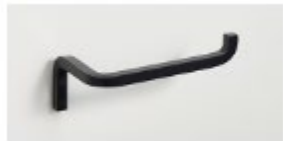
ペーパーホルダー (R)