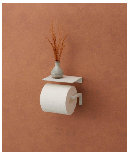
《スクリブ》設置イメージ