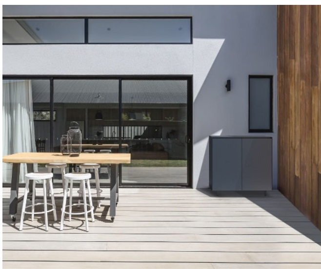
《プラムープ》ブラックの施エイメージ

住宅設備機器と建築資材のインターネット販売を行う株式会社サンワカンパニー（所在地：大阪市北区茶屋町19-19 代表取締役社長：山根 太郎、以下当社）は、2023年2月28日、屋外でも屋内でも使える物置《プラムープ》を発売します。従来の物置のイメージを覆すミニマルなデザインと、ベランダにも置けるコンパクトさを兼ね備えた商品です。